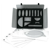
Zestaw do optyki bez tablicy metalowej, bez lasera Ray Box Nr art. 1075203