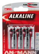
Bateria Mignon 1,5 V AA-R6 Nr art. 2004714